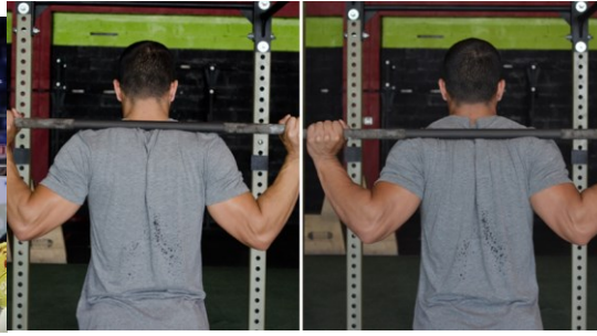
High bar vs low bar position