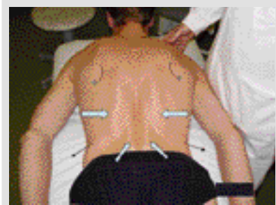
Obrázek 6. Za předpokladu insuficience HSSP se při extenzi páteře výrazně aktivuje paravertebrální svalstvo s maximem v oblasti dolní hrudní a horní bederní páteře. Neaktivuje se nebo jen minimálně dolní část laterální skupiny břišních svalů. Horní úhly lopatek se nastavují do addukce a migrují kraniiálně

vertikálně. Hrudník se v dolní části rozšíří laterálně.