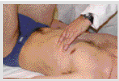
Obrázek 8. Reflexně vyvolaná aktivita břišního lisu (bránice, břišní svaly, pánevní dno), která tvoří rovnovážnou souhru s extenzory páteře

dolní nepravá žebra v medioklavikulární čáře a hodnotíme jejich souhyb.