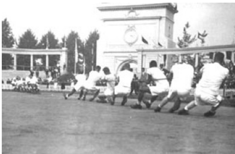
Obr.2: Přetahování lanem na olympijských hrách [2].

Přetahování lanem byl olympijský sport v letech 1900, 1904, 1908, 1912 a 1920. Sport, ve kterém získali nejvíce medailí Britové, jejichž policejní tým při hrách v roce 1908 vyhrál zlatou medaili (Obr. 2).