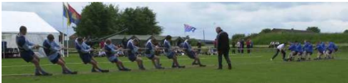
Obr.3: Současná podoba v přetahování lanem [5].

Současná podoba přetahování lanem je znázorněna na níže uvedeném (Obr.3).