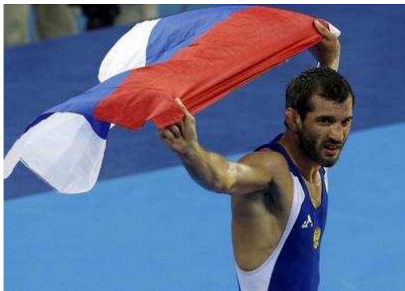
Ruský zápasník Buvaysa Saytiev

Jestliže mluvíme o Ruských zápasnících nemůžeme v žádném případě zapomenout na veleúspěšného Buvajse Sajtijeva, který obhájil ve volnostylařské kategorii do 74 kilogramů zlatou medaili z Atén a vyrovnal olympijský rekord. Třiatřicetiletý zápasník si připsal už třetí triumf na hrách, což se před ním podařilo pouze jeho krajanovi Alexandru Medved'ovi. Šestinásobný mistr světa Sajtijev ve finále porazil Soslana Tigijeva z Uzbekistánu a navázal na předchozí úspěchy z her v Aténách a Atlantě. Medved' získal v barvách tehdejšího Sovětského svazu zlato na olympiádách v letech 1964, 1968 a 1972. (Zdroj: ČTK )