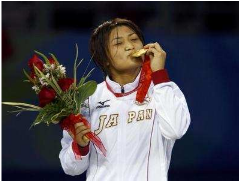
Japonská zápasnice Kaori Ičová se zlatou olympijskou medailí

Čtyřicetiletá Kaori Ičová navázala na své triumfy na světových šampionátech, kde ve své váze kraluje od roku 2002.