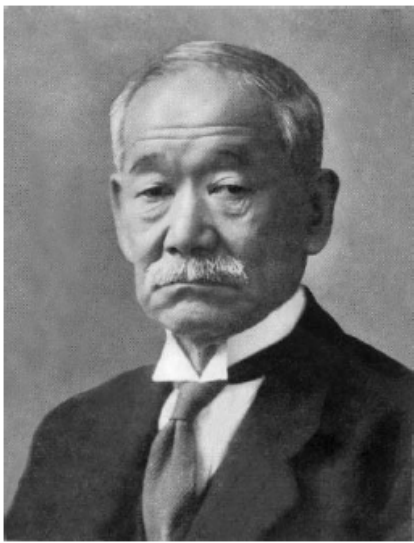
Obr. 2. Džigoro Kanó (Report 1940)