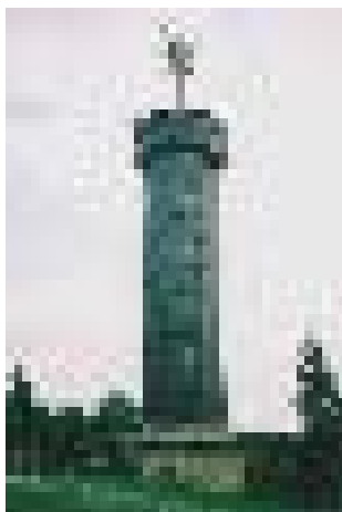
obr. 9: rozhledna Sůkenicka