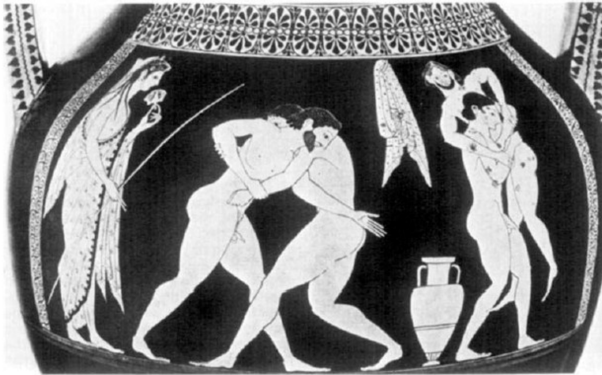
Řecko, amfora s malbou od Andocidese 525 př.n.l.