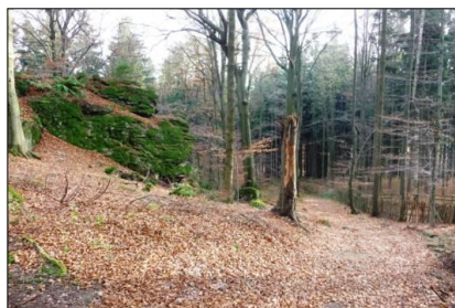
obr. 19 Přírodní památka Peperok Foto: Jiří Šiller (2010)