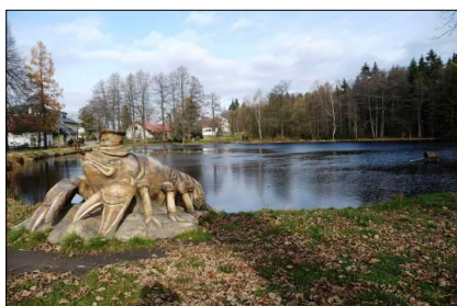
obr. 20 Račín se sochou raka Foto: Jiří Šiller (2010)

U místního rybníka se spoustou leknínů byla uctívanému rakovi dokonce postavena socha (obr. 20). V blízkosti rybníka s „rakem“ se nachází hotel a dále restaurace, které nabízejí možnost občerstvení v srdci Vysočiny.