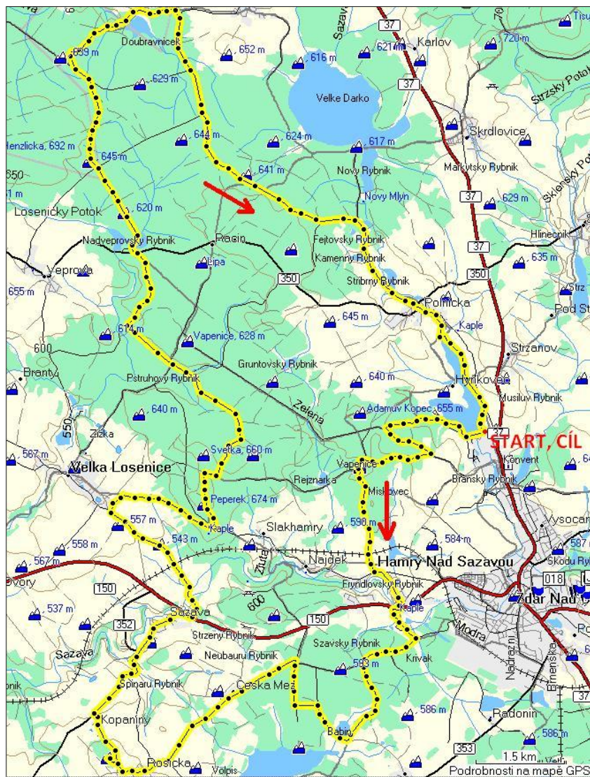
obr. 8 Mapa cyklotrasy č.1

Komentář [SH9]: mapa ve vašem případě z vizualizeru nebo every trail.com