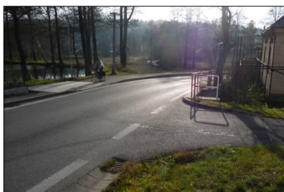
obr. 12 - Nebezpečný přejezd, Hamry n.S.

Malá kaplička na návsi pochází z roku 1871, kamenný most přes řeku Sázavu je z roku 1878, Boží muka pak dokonce z roku 1680. V Dolních Hamrech se nachází škola, autoservis, kulturní dům, dvě restaurace a dva obchody se smíšeným zbožím. [3]