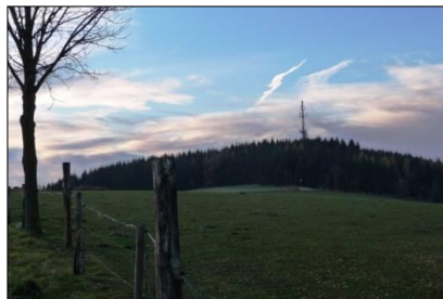
obr. 15 Kopec Rosička