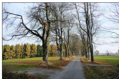
obr. 11 - Jordánek, Žďár n.S.