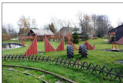
obr. 21 Zábavní centrum „Vagón“ Foto: Jiří Šiller (2010)