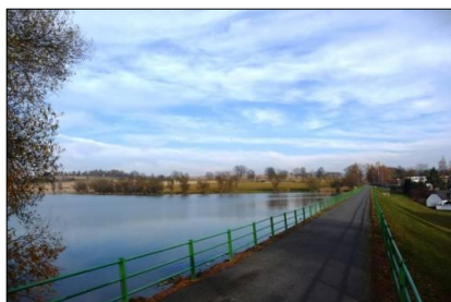
obr. 10 - Pilská nádrž ve Žďáru n.S.

narazíme na lesní asfaltku a žlutou turistickou značku. Zde se dáme vlevo, vyjždíme na hlavní silnici, kde odbočíme opět vlevo na Sázavský okruh a přes Českou Mez a Rosičku dorazíme až k rozhledně Rosička. Odtud zpátky z lesa ven, a pak ostře vlevo podél lesa do osady Kopaniny a po cestě na hlavní silnici II. třídy a dále vpravo do obce Sázava. V Sázavě u viaduktu přejíždíme silnici I. třídy a po asfaltce pokračujeme až do obce Velká Losenice. Zde hned na první odbočce vpravo projedeme rodinnou zástavbou a dále vpravo na Velkolosenický okruh, který nás lesní asfaltkou při stoupání dovede až na žlutou, kde odbočíme vlevo na Peperek. Z Peperku pokračujeme po žluté až k rozcestníku ( možnost zkrácení viz níže ) 1 a dále vpravo zpevněnou cestou až pod Shnilý kopec, kde odbočíme na asfaltovou silnici vpravo a jedeme až na hlavní silnici z Račina k Nadvepřovskému rybníku. Odtud pak po zelené až na Synkův kopec, kde odbočíme vpravo na modrou, která nás dovede kolem rybníka Doubravniček k rozcestníku Pod Kopcem. Zde odbočíme vpravo na silnici III. třídy a dále lesní asfaltkou až na červenou, kde opět odbočíme vpravo a pokračujeme do obce Polnička. Po projetí obcí se napojíme na cyklostezku kolem Pilské nádrže, po které dorazíme zpět až k výchozímu bodu.