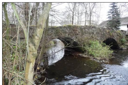
obr. 18 Kamenný most v Sázavě Foto: Jiří Šiller (2010)

Z pol.14. stol. pochází kostel sv. Jakuba Staršího, jde o jednolodí s věží u kněžiště. V sousední kostnici jsou pozůstatky vojáků ze sedmileté války (1756 – 1763). Pamětní deskou je od r. 1938 opatřen dům čp. 24, z něhož pocházel rod K.Havlíčka Borovského. V obci se nachází škola, pošta, restaurace, cukrárna a nákupní středisko. [3]