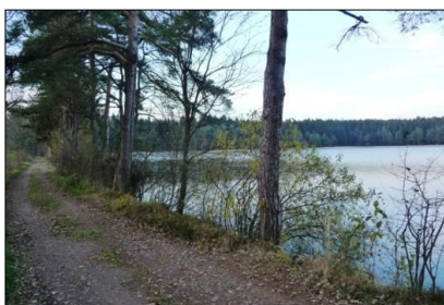
obr. 13 - Babínský rybník Foto: Jiří Šiller (2010)