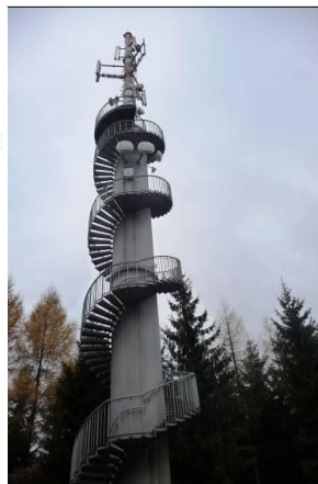
obr. 16 Rozhledna Rosička