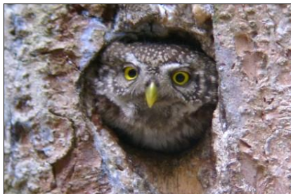
obr. 14 Kulišek nejmenší [19]