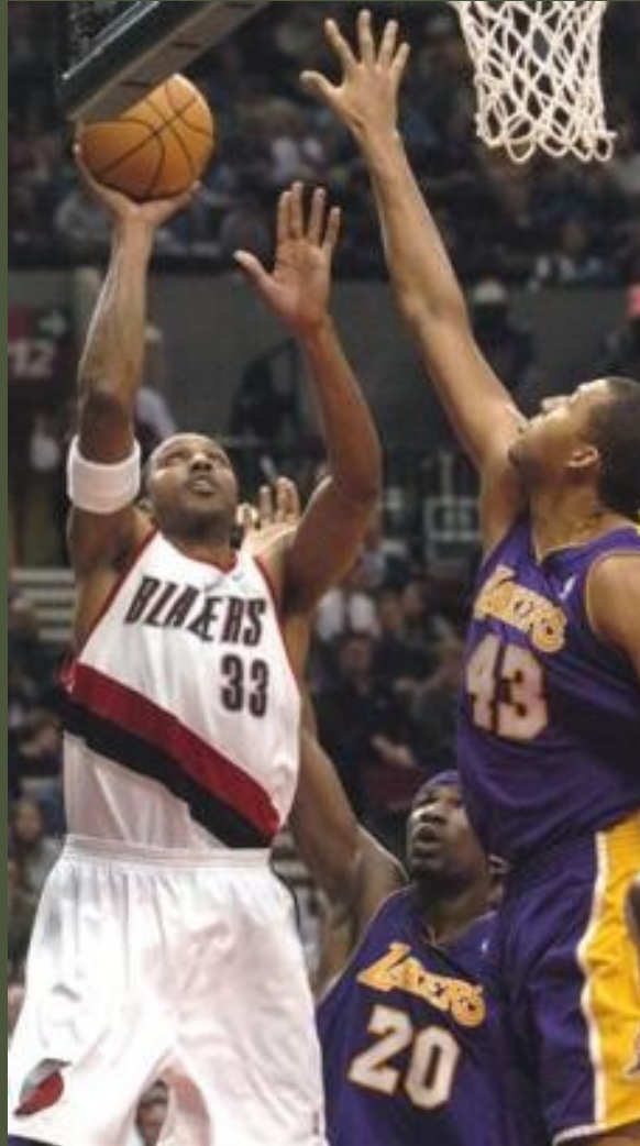
Střelba napnutou paží (jump shot)