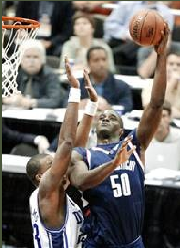
Další varianta střelby přes hlavu (hook-shot)