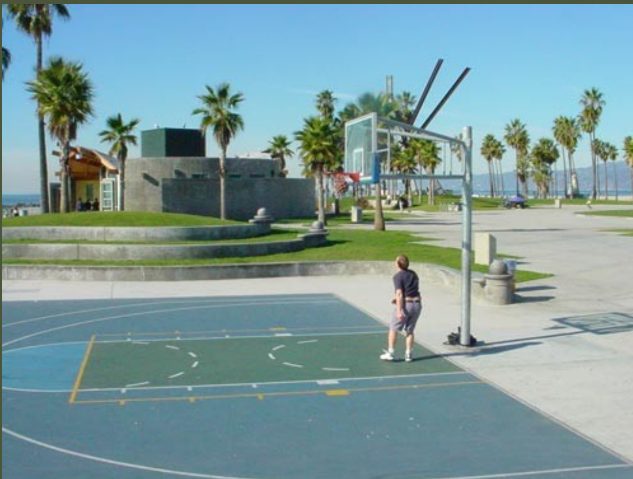
Typický obrázek streetballového hřiště v USA