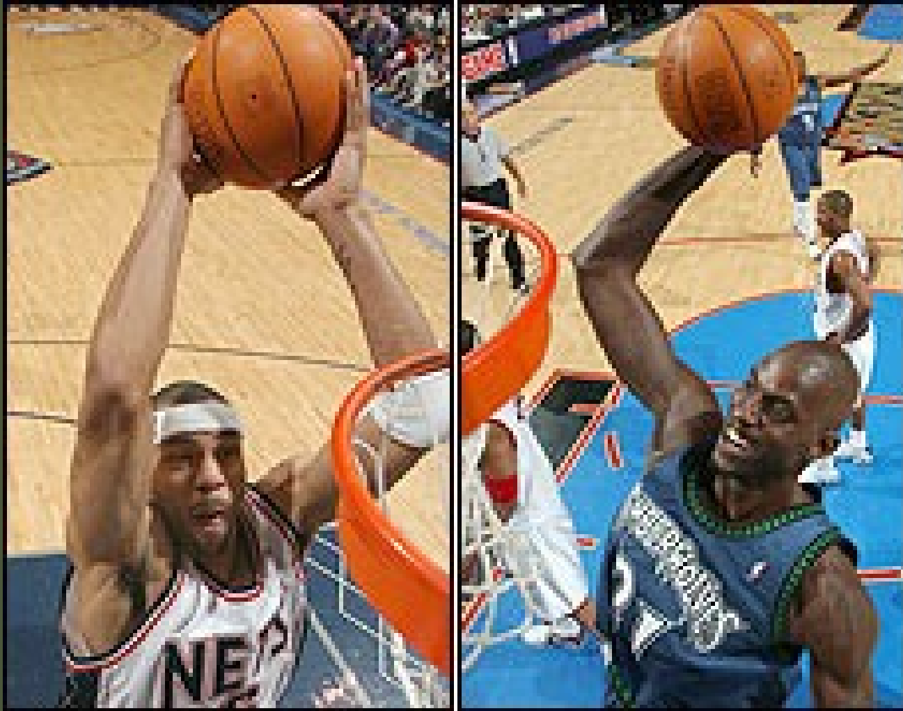
Střelba smečováním – dvěma, jednou rukou