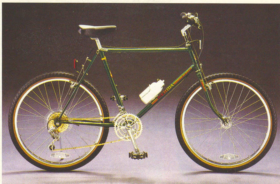
Jedna z prvních horských kol Meridy a Treku.