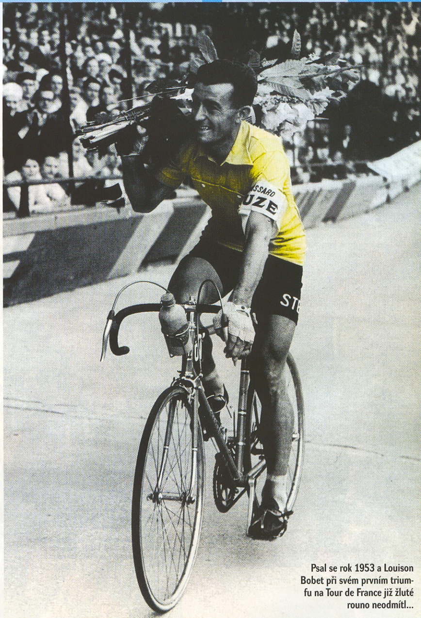
Psal se rok 1953 a Louison Bobet při svém prvním triumfu na Tour de France již žluté rouno neodmítl...

Ne děkuji, já chci klasický vlněný dres, požadoval mladíček a pořadatelé závodu se ocitli v nesházích. Smlouva se Sofilem byla ohrožena a pokud by se Bobetovo zdůvodnění dostalo na veřejnost, pro pověst textilního výrobce a jeho nového produktu by to mělo nedozírné následky. Naštěstí pro sponzora i závod samotný Bobet v cíli etapy dres přijal a až večer se rozhodl ho organizátorům vrátit. Goddet se tu zprávu dozvěděl u večere. Ředitel závodu nelenil, odložil příbor a vydal se ihned nasupěný do hotelu za rebelujícím závodníkem. Debata se protáhla až do noci. Bobetova hlava byla tvrdá jako žula na bretaňském pobřeží, kde vyrostl.