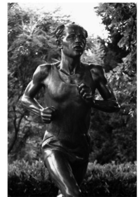
Scheider Eli - Emil Zátopek, Mese Olympique Lonsanne, 2007