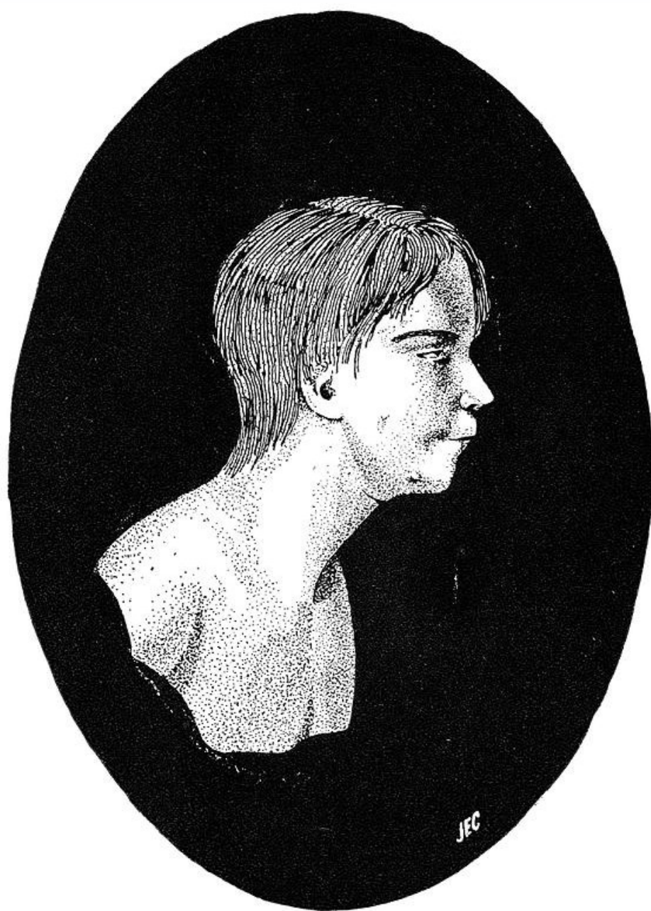
THE WILD BOY OF AVEYRON There were twenty-six scars about his head and body