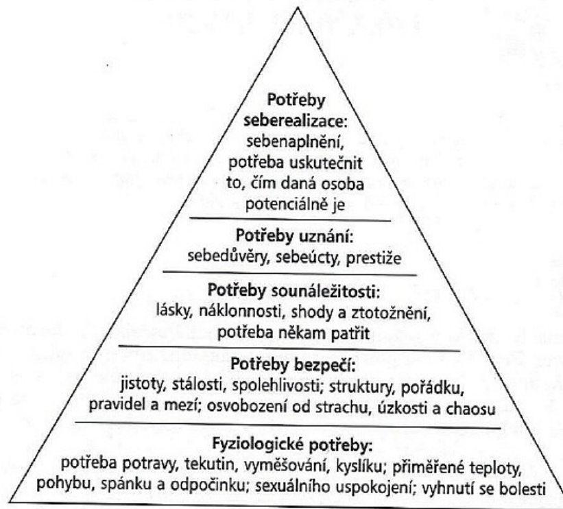
Hierarchie potřeb podle A. Maslowa