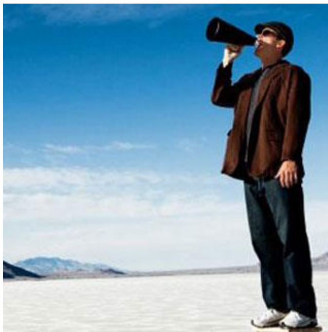
PR JAKO NÁHRADA REKLAMNÍ KAMPANĚ

V managementu sportu, obdobně jako v jiných oblastech, je žádoucí, aby tyto zásady převzali vedoucí pracovníci do svého vystupování a jednání. Zvládat základní pravidla etikety, pracovat na tvorbě žádoucího prvního dojmu i osobní image, umět oslovit a přesvědčit, zlepšovat rétorické dovednosti, korigovat nežádoucí verbální a neverbální projevy a ovládat zásady efektivní komunikace je potřebné a přínosné.