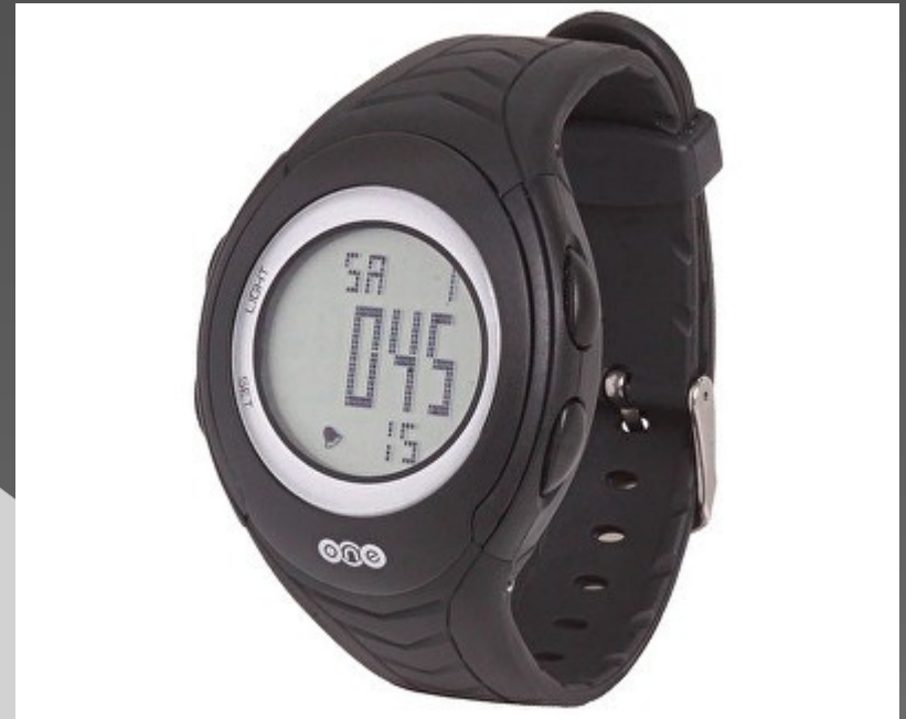
Just One Pulsmetr ALPHA 22.0