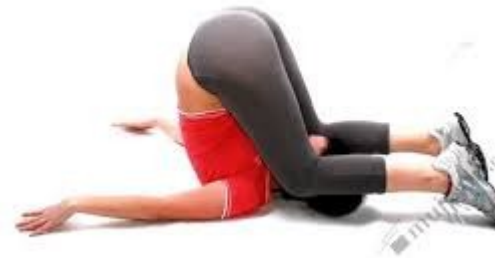
leh vznesmo roznožný pokrčmo

Leh sedmo – trup je opřen o šikmou základnu pod úhlem menším než 45^{\circ} a část hmotnosti spočívá na hýždích.