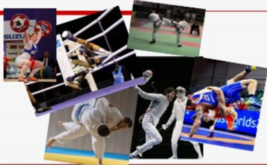
Překonat soupeře – tělesnou, technickou, taktickou převahou. Struktura složitá, variabilita vysoká, tvořivé myšlení, anticipace záměrů soupeře