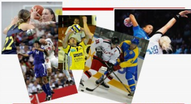
Překonat soupeře, zvítězit v utkání, pohybová struktura složitá, variabilita vysoká, tvořivé myšlení, anticipace záměrů soupeře