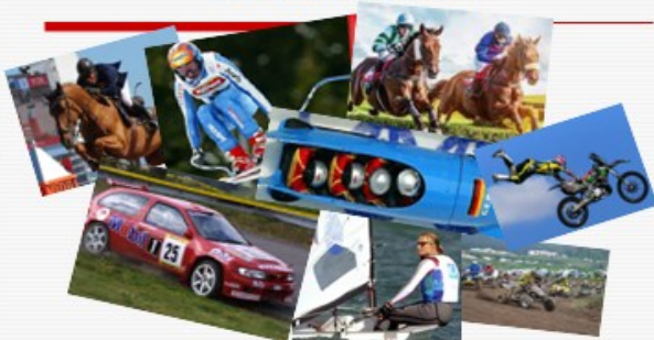
Překonat stanovenou vzdálenost v co nejkratším čase pomocí stroje nebo náčiní. Struktura pohybu složitá, variabilita vysoká, psychická odolnost...