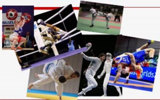
Překonat soupeře – tělesnou, technickou, taktickou převahou. Struktura složitá, variabilita vysoká, tvořivé myšlení, anticipace záměrů soupeře