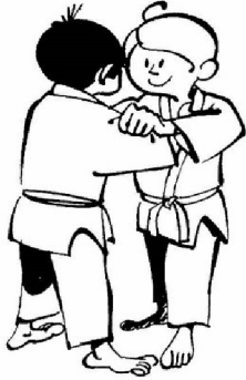
(„451840.gif (515×794)", b.r.)