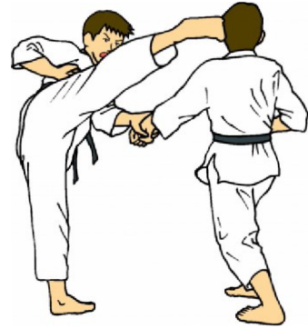
(„clip3.jpg (660×720)", b.r.)