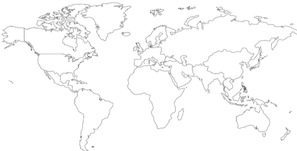
(„WorldMercatorContinents.jpg (1516×1161)", b.r.)

Na mapě označ a pojmenuj stát, ze kterého džúódó pochází.