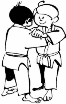
(„451840.gif (515×794)", b.r.)