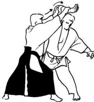
(Westbrook & Ratti, 2005)