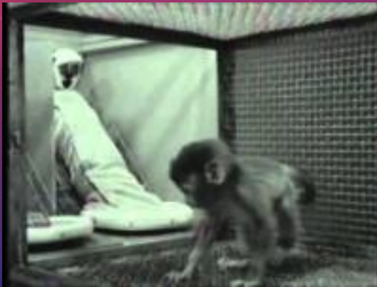
Výzkumy Harryho Harlowa – The Nature of love