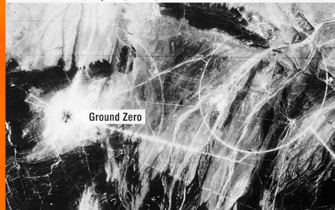
Nuclear Test Site, Lop Nur, China, 20 October 1964