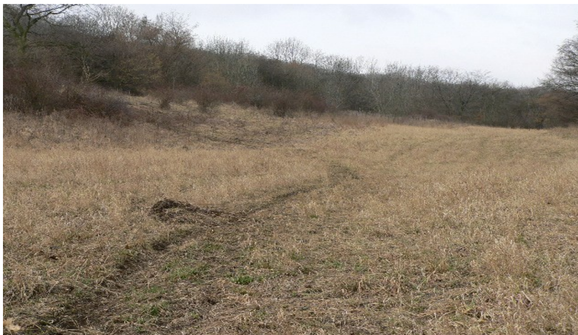
fotografie č. 4