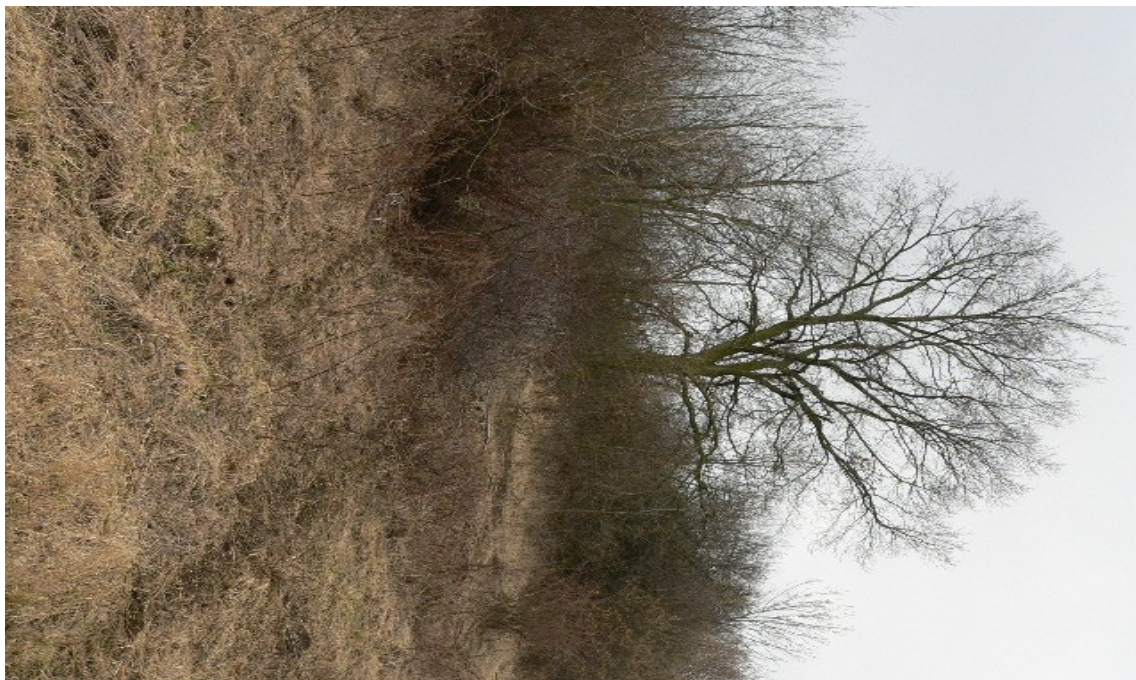
fotografie č. 3