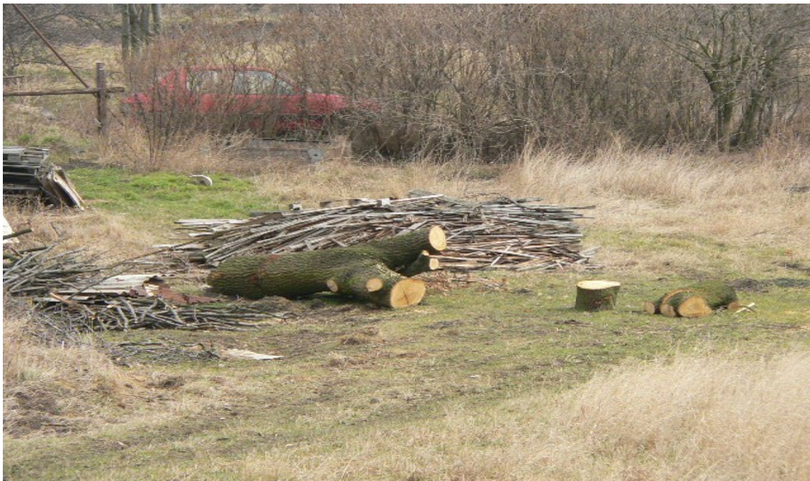
fotografie č. 6