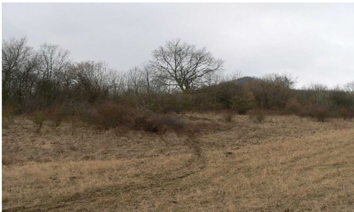
fotografie č. 15