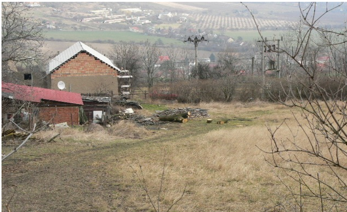
fotografie č. 7