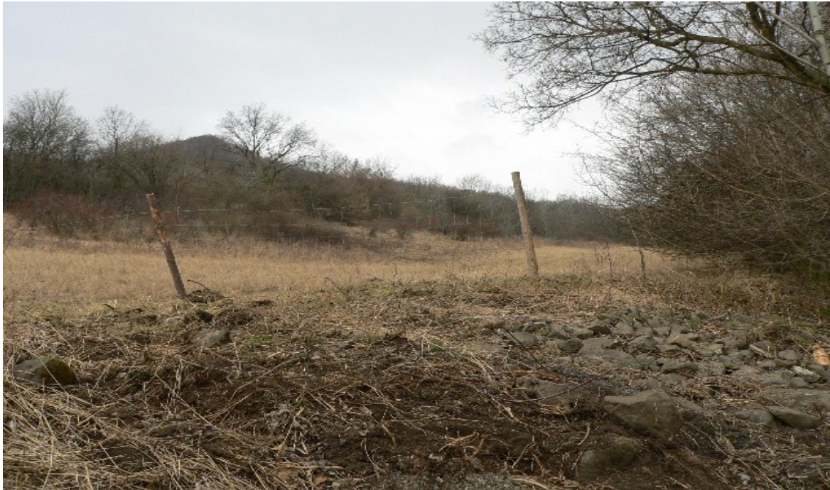
fotografie č. 11