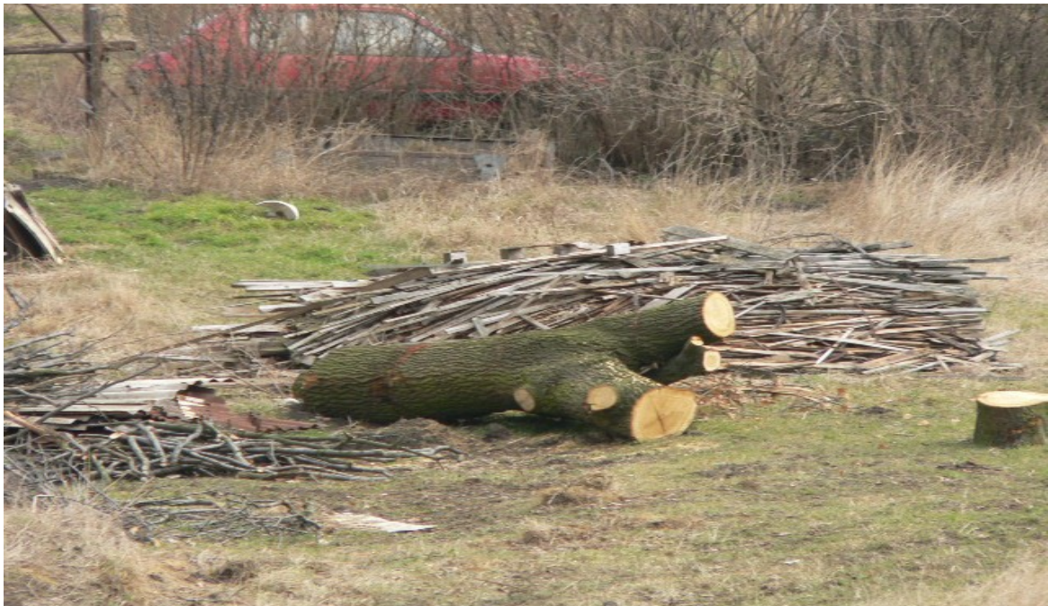
fotografie č. 12