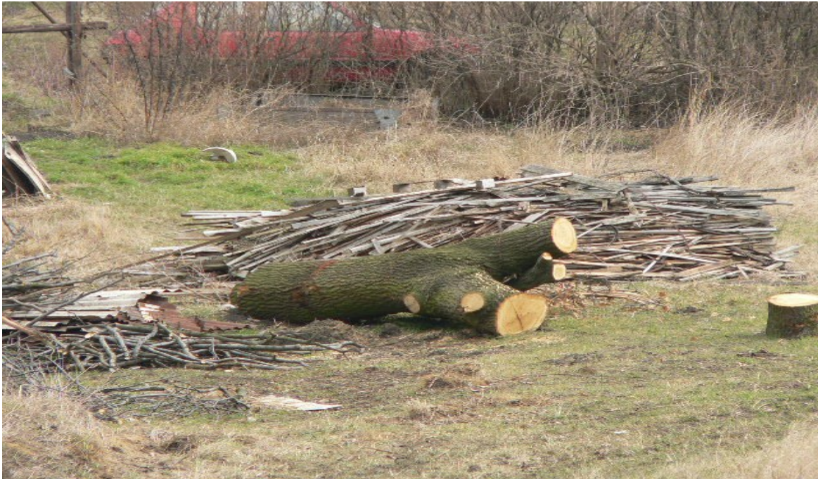
fotografie č. 9