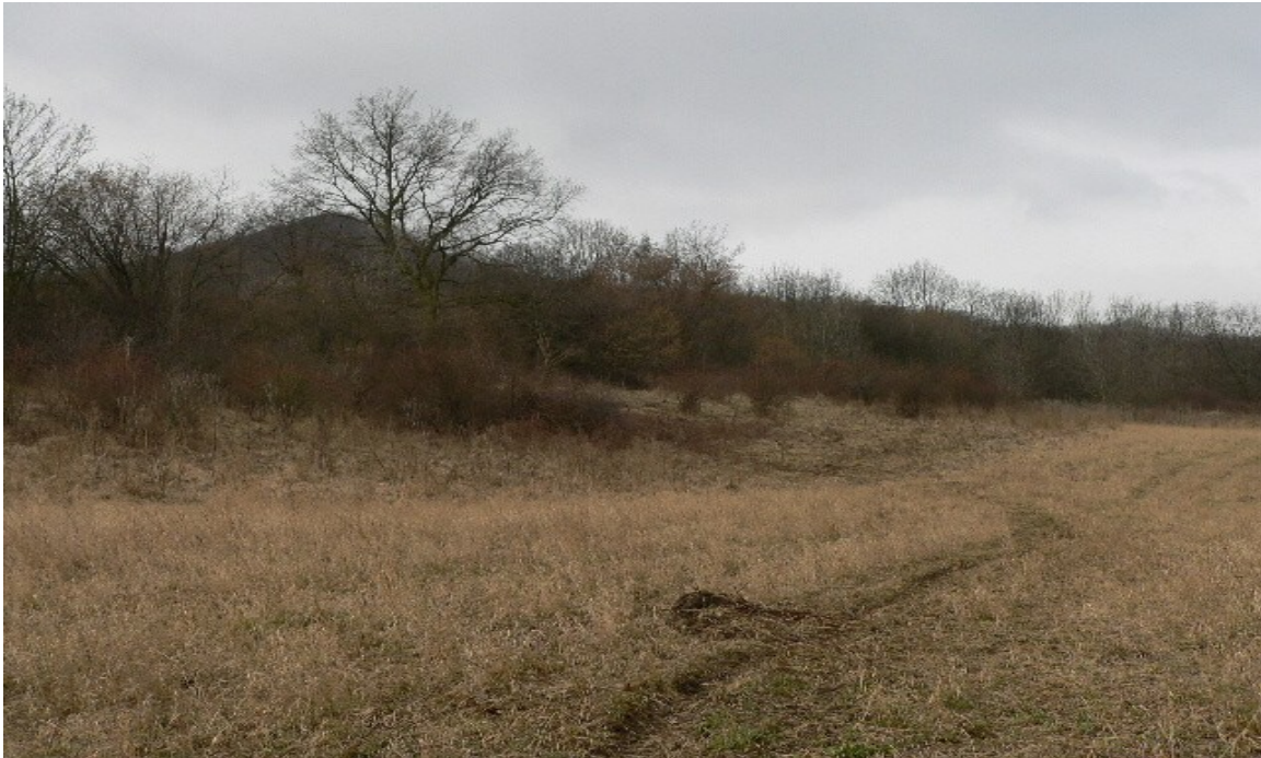
fotografie č. 5