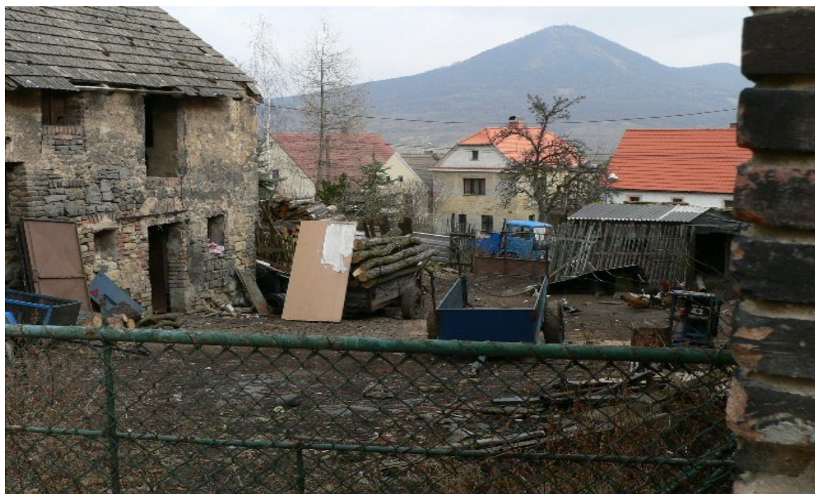
fotografie č. 16