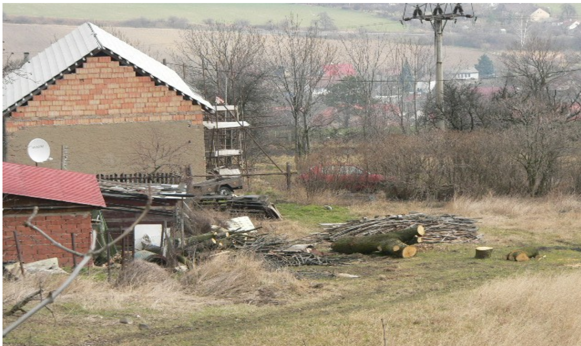
fotografie č. 13