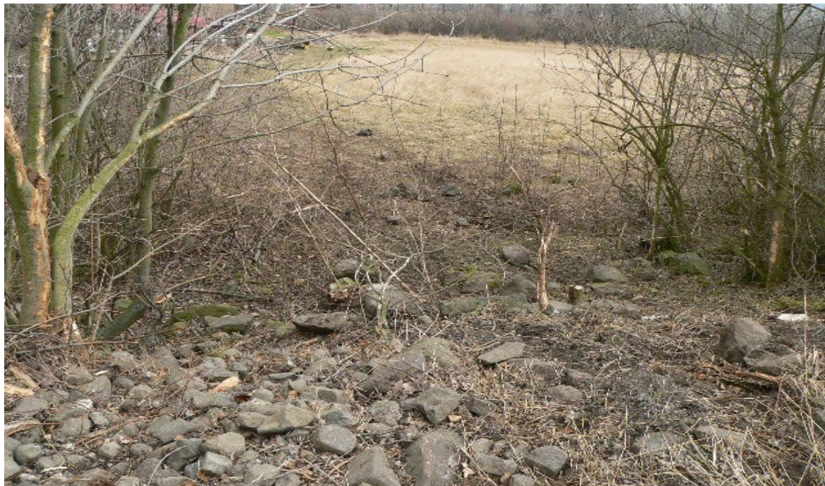
fotografie č. 10