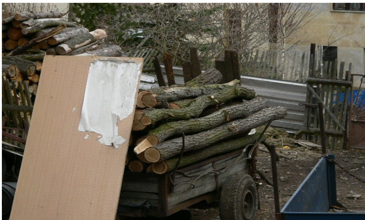
fotografie č. 17