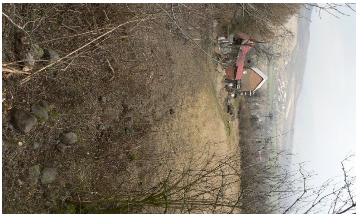
fotografie č. 8