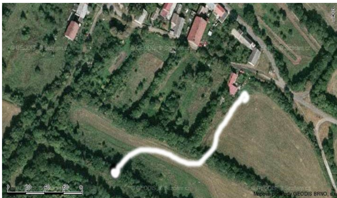
fotografie č. 18