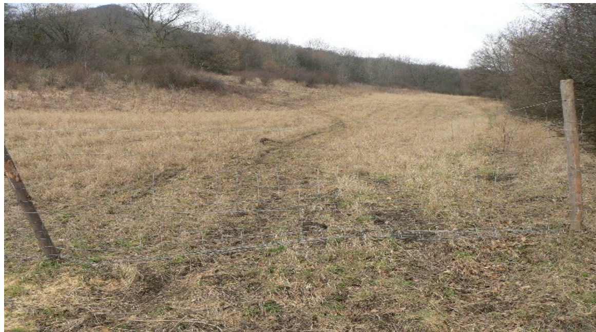
fotografie č. 14