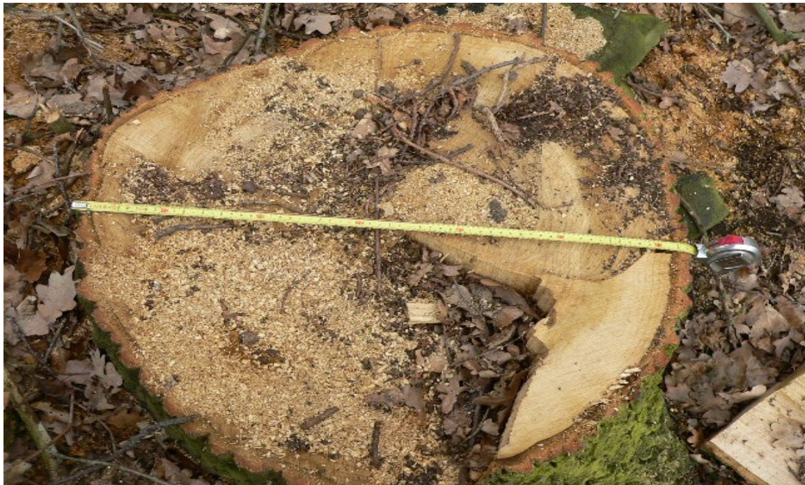
fotografie č. 1