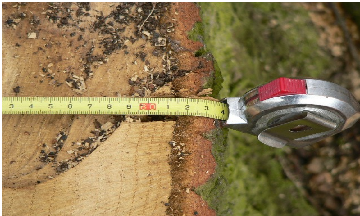
fotografie č. 2