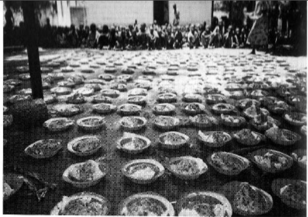
Figure 3.2 International Committee of the Red Cross 'feeding centre' at Tonj, southern Sudan.