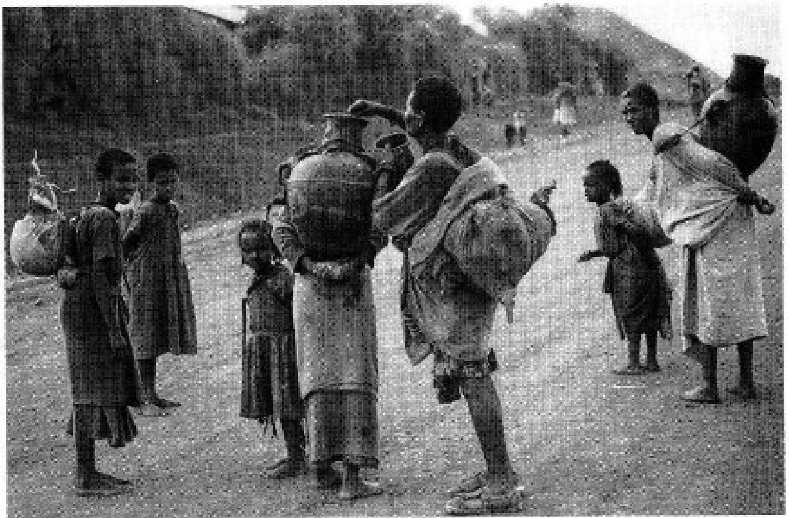
Figure 3.4 Social collapse. Families leaving home: collecting water to go to Korem relief camp, Wollo, Ethiopia, 1984.