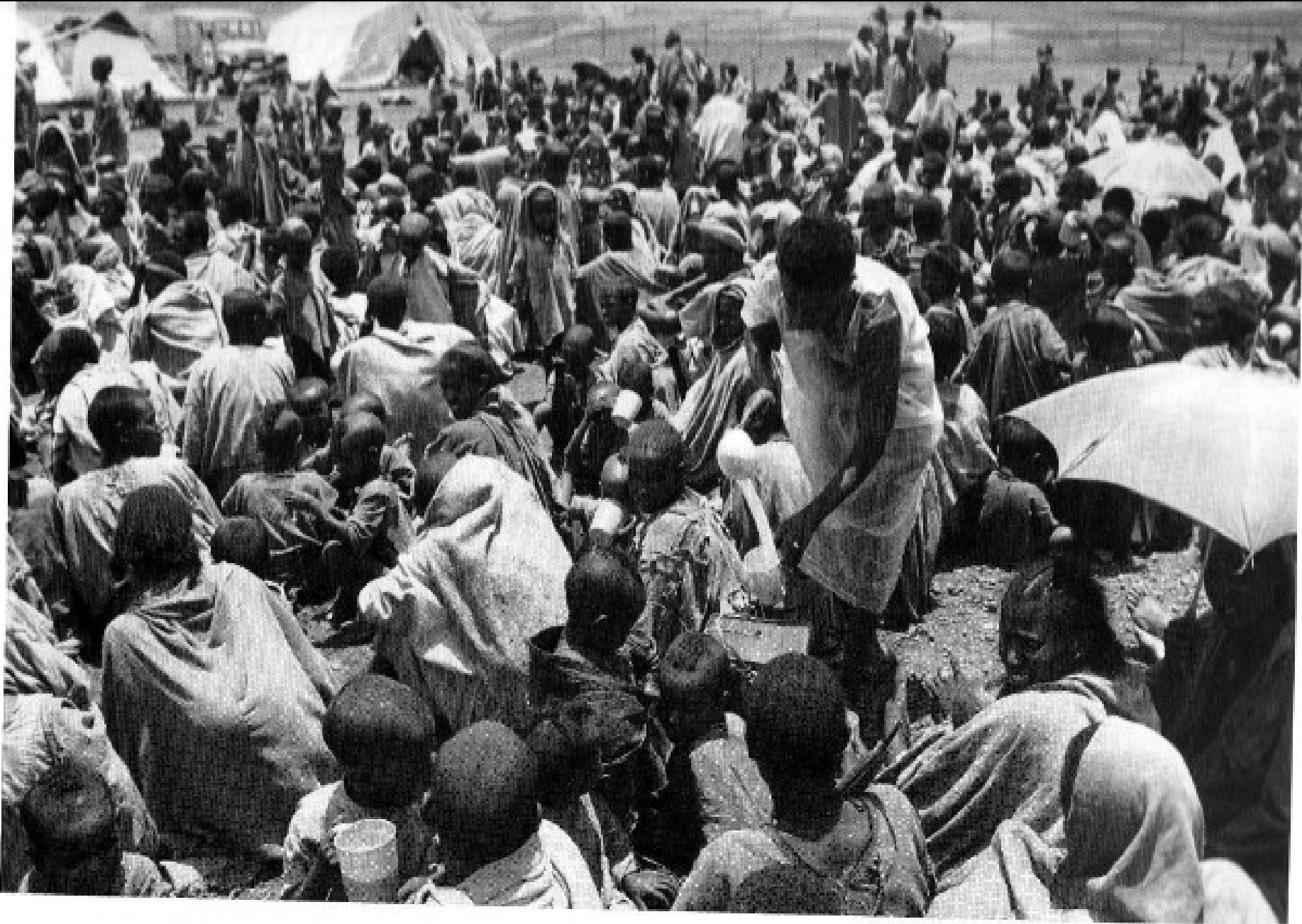
Figure 3.5 Korem relief camp, Wollo, Ethiopia, 1984.