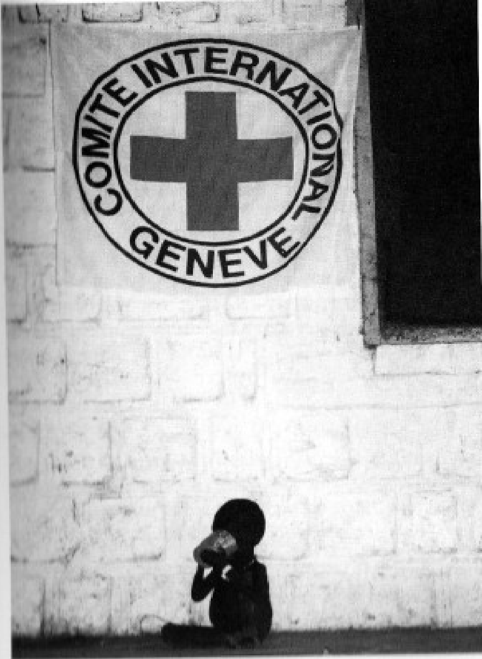
Figure 3.7 A simple message? 'Tbnj: drinking a cup of milk to survive' (Red Cross photo and caption).