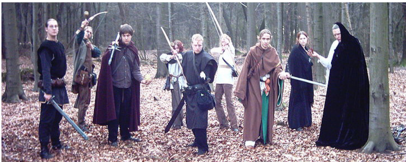
LOACHŮV SNÍMEK v žádném případě nebyl považován za adepta na výhru, nicméně festival v Cannes je pověstný tím, že vítězné snímky lze těžko předpovědět.

Bouchareba. Hlavní roli v Návratu ztvárnila Penelope Cruzová, považovaná až do konce za hlavní favoritku na hereckou cenu. „Ve skutečnosti tato cena patří Pedrovi (Almodóvarovi) - je to jedna z nejlepších lidských bytostí, jakou jsem kdy poznala,“ reagovala na výsledky. Cenu jury obdržel film