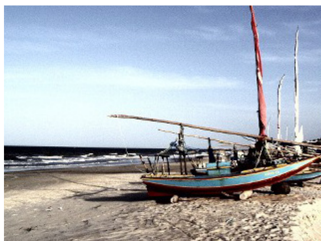
LOACHŮV SNÍMEK v žádném případě nebyl považován za adepta.

Loachův snímek v žádném případě nebyl po-