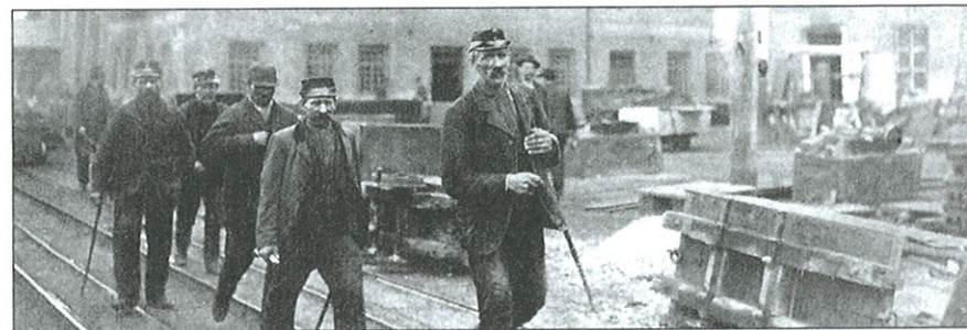
EKONOMICKÁ STRUKTURA ČESKÝCH ZEMÍ