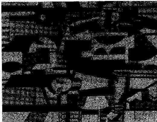
Segmentarity (soubor typů)

Jsme segmentarizováni odevšad a všemi směry. Člověk je segmentární tvor. Segmentarita patří ke všem stratum, jimiž jsme tvořeni. Bydlet, pohybovat se, pracovat, hrát si: život je prostorově a společensky segmentarizován. Dům je segmentarizován podle účelů jednotlivých místností; ulice podle uspořádání města; továrna podle povahy prací a úkonů. Jsme segmentarizováni binárně , podle velkých duálních opozic: společenské třídy, ale také muži a ženy, dospělí a děti atd. Jsme segmentarizováni kruhově , v čem dál širších kruzích, čím dál větších discích a mezikruzích, na způsob Joyceova „dopisu“: mé záležitosti, záležitosti mé čtvrti, mého města, mé země, světa... Jsme segmentarizováni lineárně , na přímce, přímkách, kde každý segment představuje epizodu nebo „proces“; jakmile ukončíme jeden proces, už začínáme jiný, navzdý řídicí nebo řízení, v rodině, škole, ar-