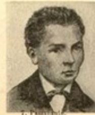
7. P. M.