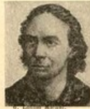
6. L. M.