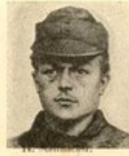
14. M. S.