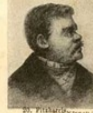
20. M. S.