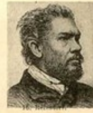
16. M. S.