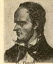
11. F. S.