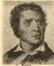
2. M. A.