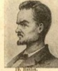
19. M. S.