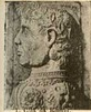
1. C. de S. S.