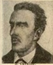
5. C. M.