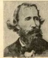
8. M. S.