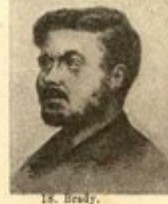
18. M. S.