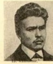
15. M. S.