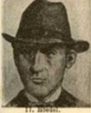
17. M. S.