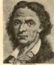
10. S. M.