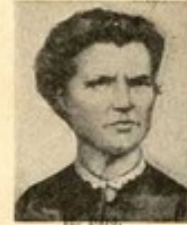
12. M. S.