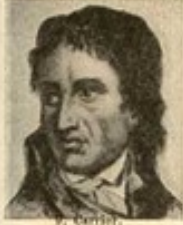
9. C. S.