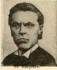
13. M. S.