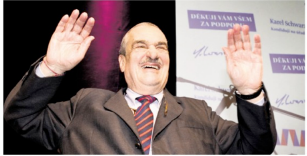
Překvapení vítědní Karel Schwarzenberg se dotkl na Mladé Zeman – získal jen o necelých procentech méně. Tak šelby možná v první kole volby nečkal ani on sám. ● Rozhovory v úvodu volby na str. A6 a A7

Do finále jdou Miloš Zeman a Karel Schwarzenberg. Po Havlovi a Klausovi bude opět výrazný prezident.