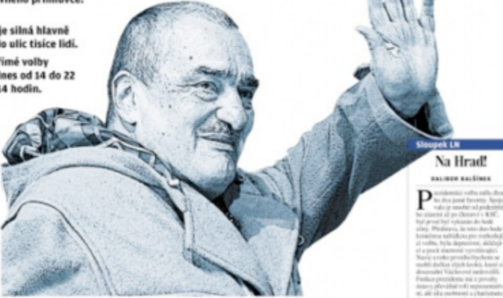
Sloupek LN Na Hrad! DALŠÍM BĚŽNÍKEM

PODPORA: Karel Schwarzenberg získal na poslední chvíli vlivného přímluvce: Jana Švejnara. FINÁLE: Jeho pozice je silná hlavně v Praze, kde dostal do ulic tisíce lidí. VOLBA: První kolo přímé volby prezidenta se koná dnes od 14 do 22 hodin, zítra od 8 do 14 hodin.