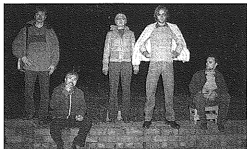
Fotografie z videoprojektu Strojitelé od skupiny Čto dělat , realizace Čaplíja [Olga Jegorovová], Nikolaj Olejnikov a Dmitrij Vilenskij