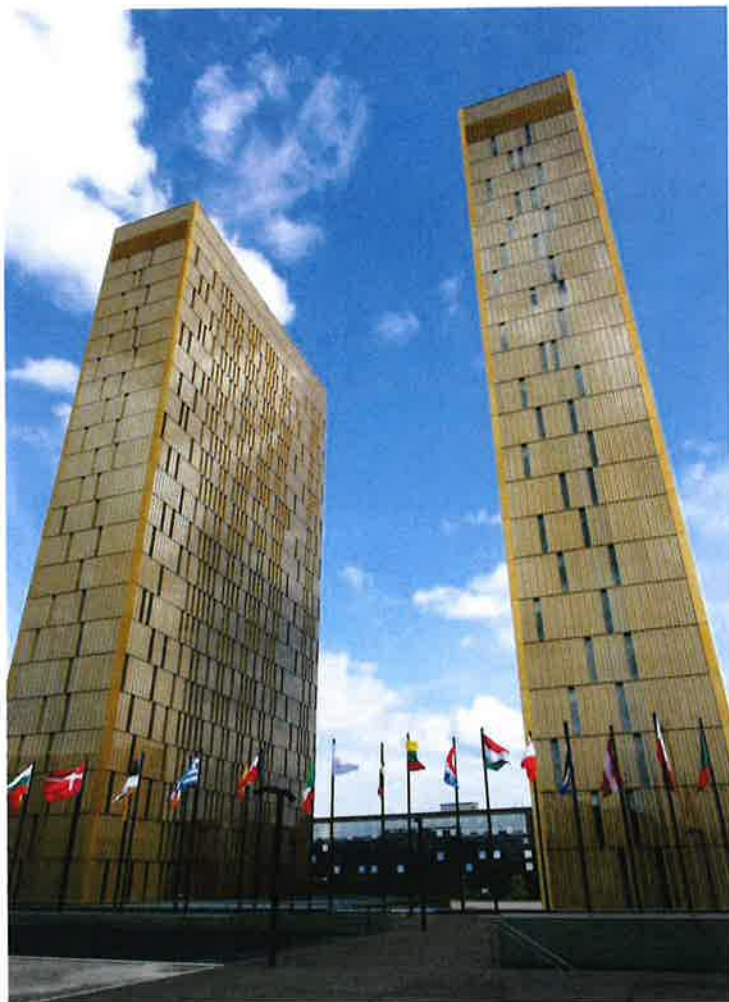
Soudní dvůr Evropské unie [3]

konáním nepřekročila kompetence, které jí daný členský stát svěčil. Velmi aktivní v tomto směru je německý Spolkový ústavní soud.