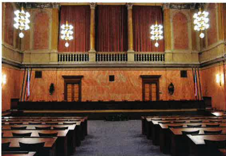
Jednací síň Ústavního soudu ČR [5]

převzal Tribunál. Současně se složení Tribunálu rozšířilo na dvojnásobek.