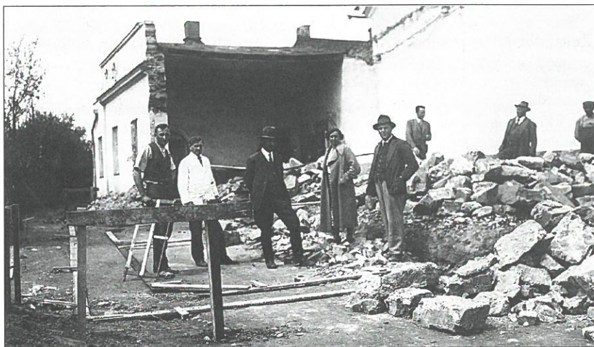
Bourání zakoupeného domu za účelem výstavby nového domu rolnické záložny v Postřelmově, okr. Šumperk, založené v roce 1868

Aniž by o tom věděl, situace ve světě ještě ztěžovala jeho situaci. Rakouské válečné neúspěchy v Itálii a pruský vpád do Čech v roce 1866 přispěly k problémům v zemědělství. Cena obilí na evropském trhu klesala v důsledku konkurence ze zámoří, což vedlo k všeobecné ekonomické krizi v roce 1870. Nepřekvapí proto, že s postupem času se zemědělec, zbavený všech omezení, co se týče odprodeje svého majetku, často vydaný všanc bezcharakterním obchodníkům a lichvářům, stával chudším a chudším a jeho hlavní útěchou byla láhev s alkoholem.