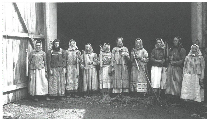
Z velkostatku ve Stádlci, okr. Tábor (1916)

oblastech – Dánsko se svými mlékařskými družstvy, Kanada s obyčtovými družstvy na prodej pšenice, 12) Itálie se zemědělskými výrobními družstvy – žádná se nevyrovná solidnosti jeho organizace a účinnosti jeho kombinovaného úsilí. 13)