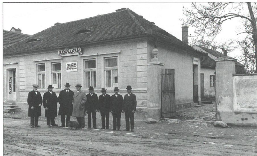
Kampelička v Plané nad Lužnicí, okr. Tábor

Během dalších deseti let se tato vesnická úvěrní družstva rychle šířila a stala se záhy pilířem celého zemědělského družstevního hnutí v Čechách, na Moravě a ve Slezsku a později v Československé republice. Jednoduchost jejich organizace i družstevní charakter služeb zůstaly zachovány v průběhu celé jejich historie a jsou klíčem k pochopení jejich úspěšnosti. Heslem těchto družstev bylo: Pomoc, nikoliv zisk. 26) Tyto kampeličky, jak se jim říkalo, byla úvěrní družstva, založená na principu neomezeného ručení, jak to umožňoval družstevní zákon z roku 1873. Díky podobnosti s Raiffeisenovými družstvy v Německu byly někdy nazývány Raiffeisenkasse, zejména v německy mluvících oblastech.