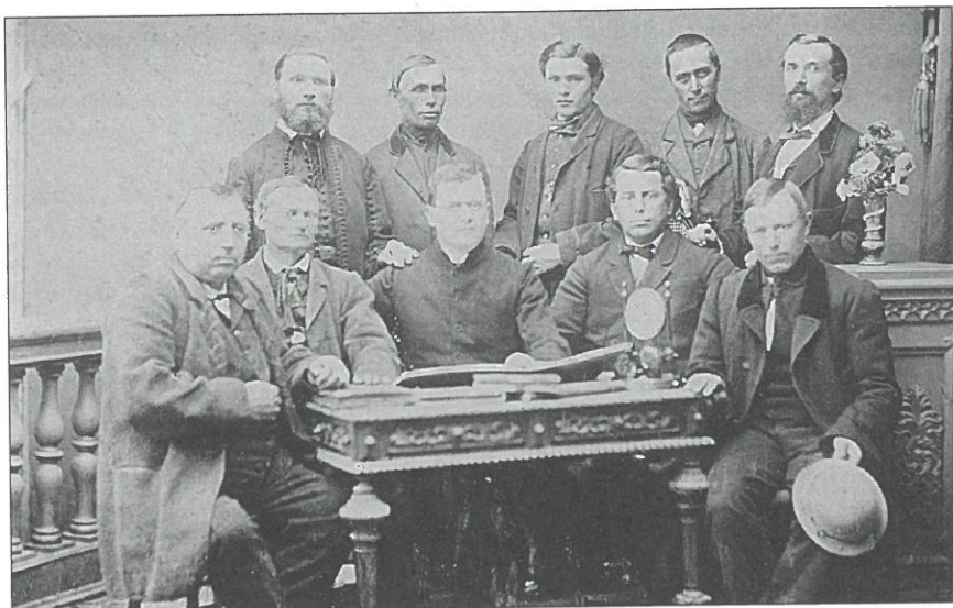
Výbor rolnické záložny v Olšanech, okr. Šumperk (1868)

Je třeba si ovšem uvědomit, že všechna tato raná družstva vznikala na základě rakouského zákona o obchodních společnostech, protože v té době neexistoval speciální družstevní zákon. Český zemský sněm sice jednal o družstevním zákoně, který předložil známý český profesor práva Antonín Randa, ale zákon nebyl přijat; ve stejný den předložil podobný zákon Schultze-Delitsch a jednalo se o něm v pruském Landtagu .