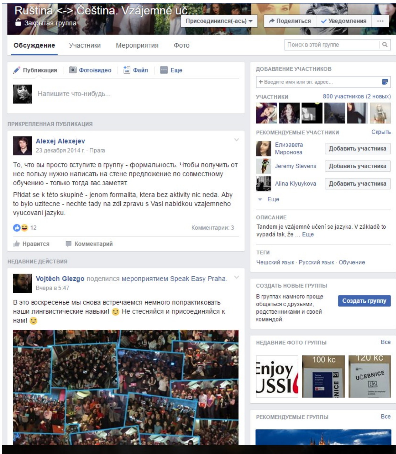
Obrázek 3. Facebooková stránka sdružení lidí studujících češtinu a ruštinu.