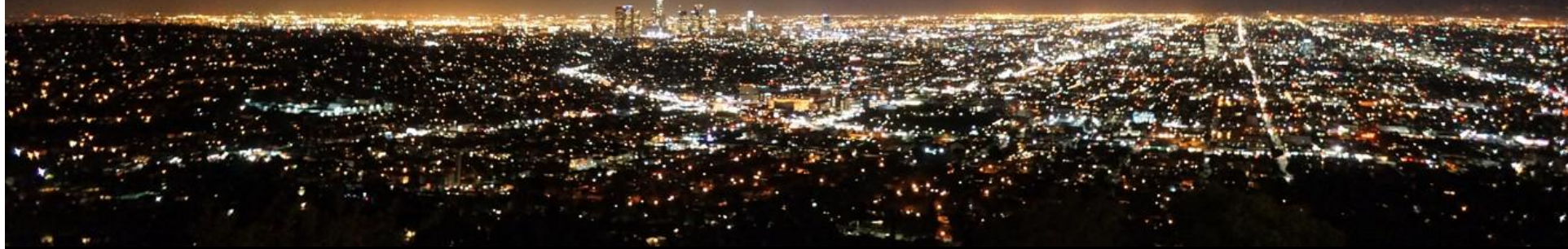
Paradigmatické město - planetární urbanizace