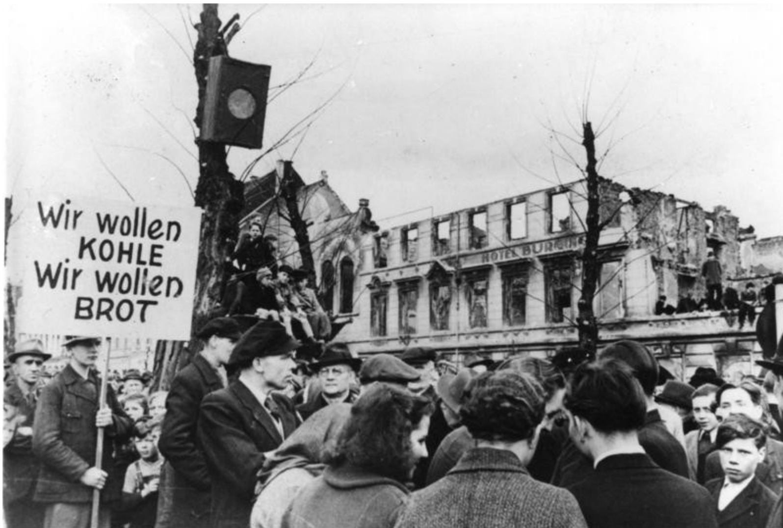
31. März 1947