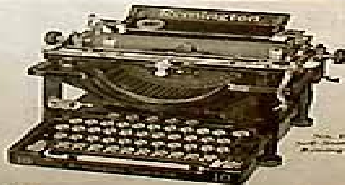
No. 22 Self-Starter Remington

214 Broadway, New York, Branches Everywhere REMINGTON TYPEWRITER CO., Ltd. 241 Rue de la Paix, Paris.