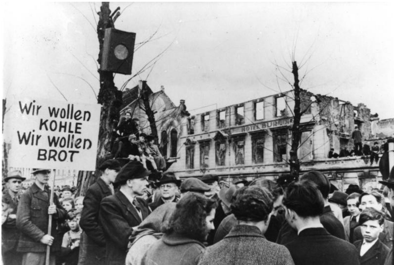
31. März 1947