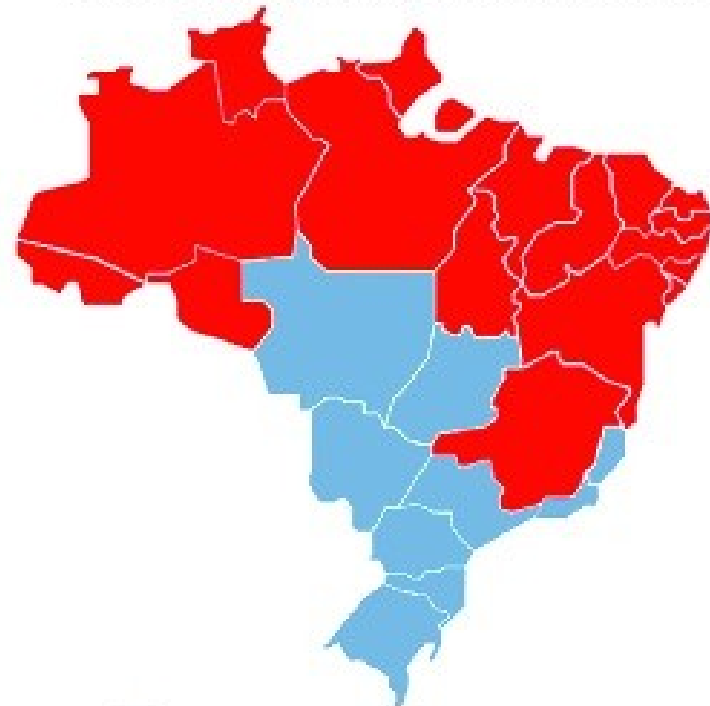
Bolsa Familia social welfare program