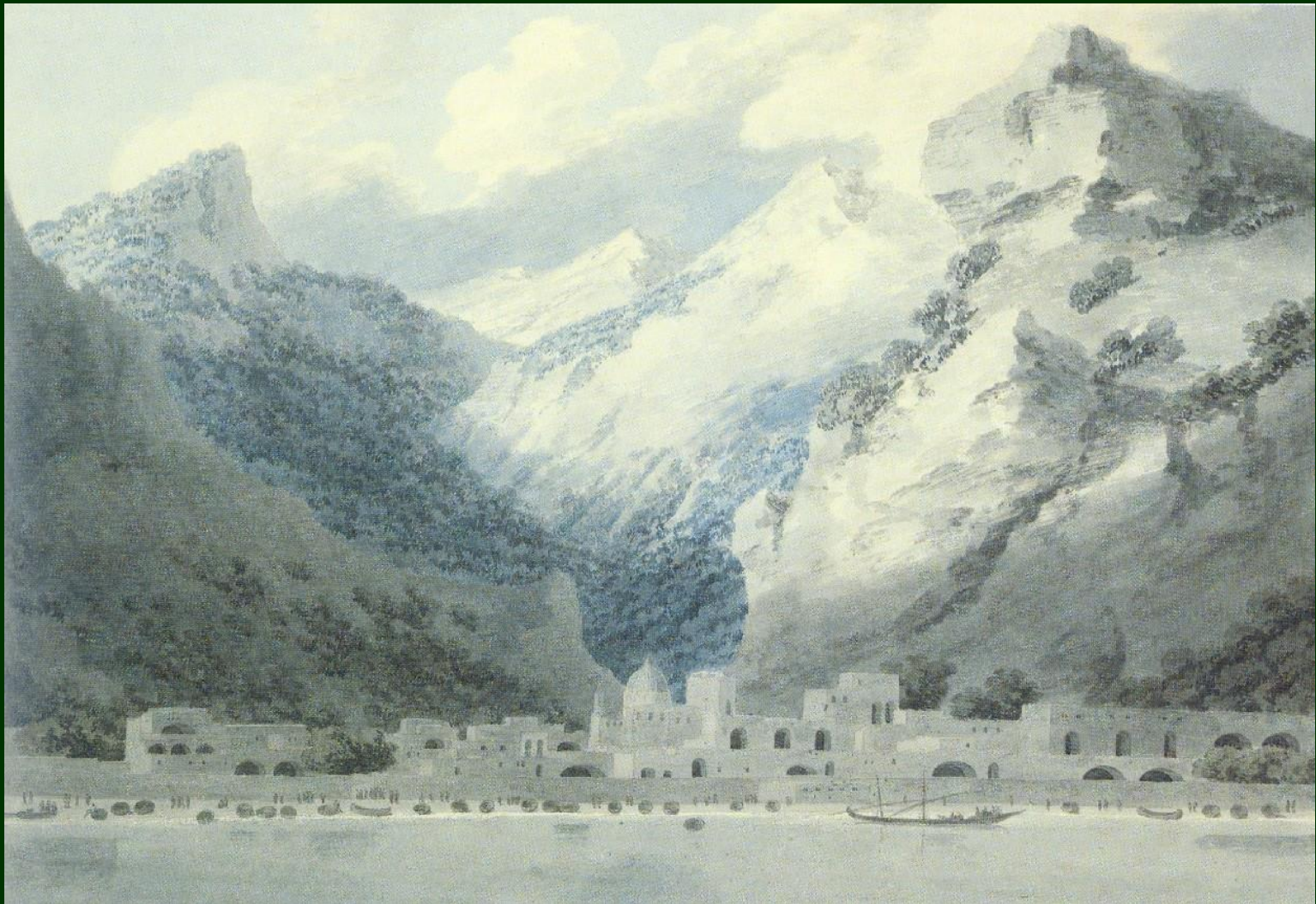
John Robert Cozens: Cetara on the Gulf of Salerno, 1790