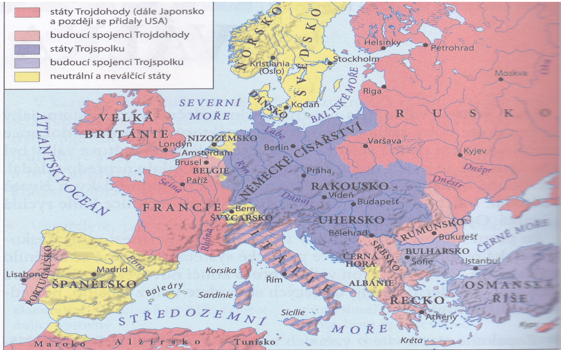
Evropa před první světovou válkou