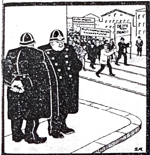
Všichni se nám snažíme být, je to naše jediná šance, pokud budeme v republikě šťastnější, budeme mít pořádek doma!