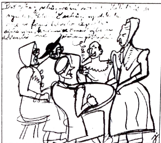
Karikatura reagující na zákaz veřejných shromáždění, vydaný v důsledku válečného nebezpečí, nakreslená v redakčním „cancbuchu“ Lidových novin dne 13. 9. 1938

Tento spontánní optimismus, který Lidové noviny na svých stránkách tlumočily, však neměl dlouhého trvání. Již ve čtvrtek 29. září musely přinést jiné zprávy: Poslední pokus: schůzka čtyř - Dnes budou v Mnichově jednat Chamberlain, Daladier, Hitler a Mussolini. Redaktoři Lidových novin si uvědomo-