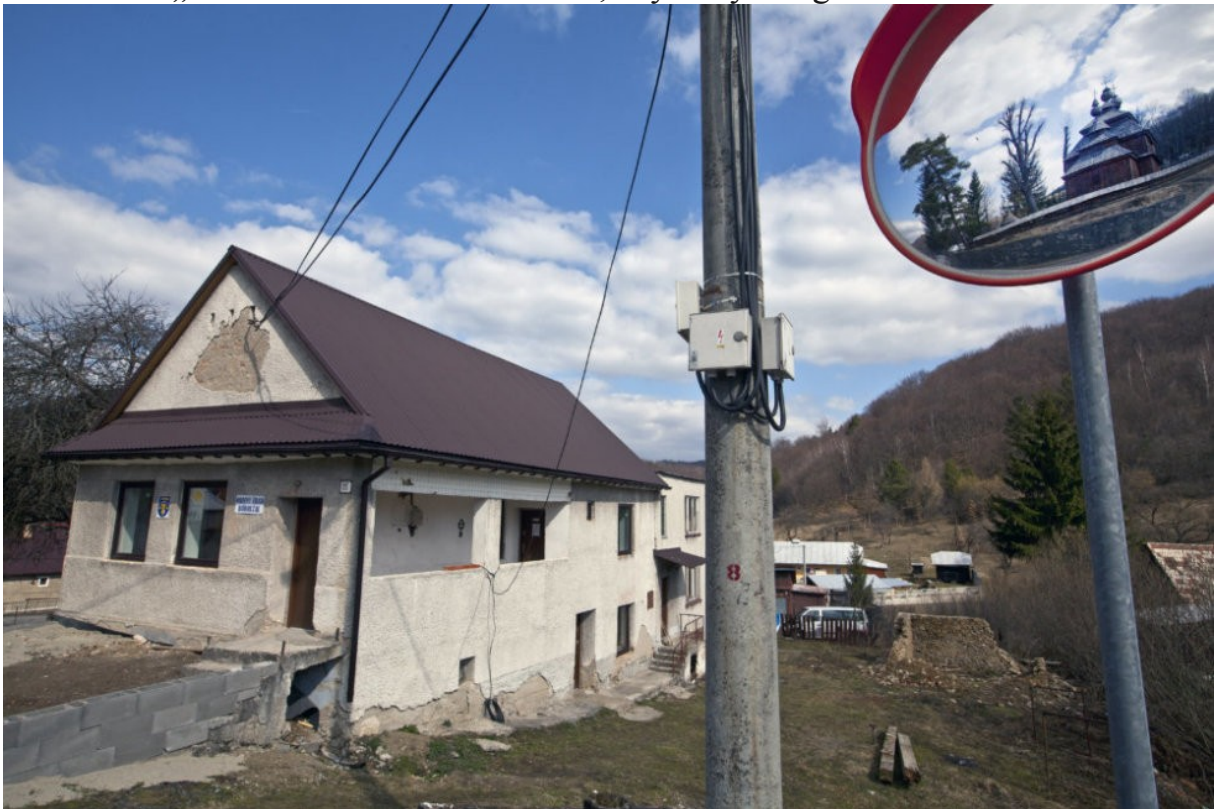
V Bodružale získal Harabin 65 procent hlasů.

„Harabin nebude s jednou ani druhou stranou, má své trápení. Dal jsem mu svůj hlas. Čaputová bude škodit, stejně jako Kiska doposud. S Kotlebou se nikam nedostanete. A na Šefčoviče se vys**li za to, že je se Směrem...“ Větu už nedokončí. „Pssst!“ okřikne ho manželka, aby nebyl vulgární. Muž mávne rukou.