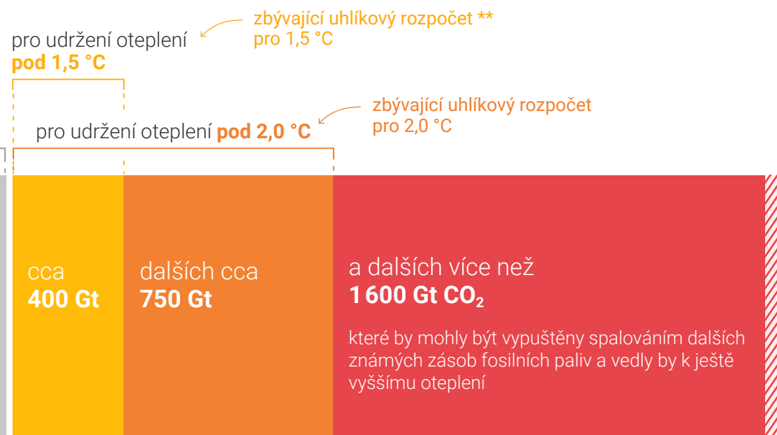
Globální emise CO 2 z dalšího spalování fosilních paliv