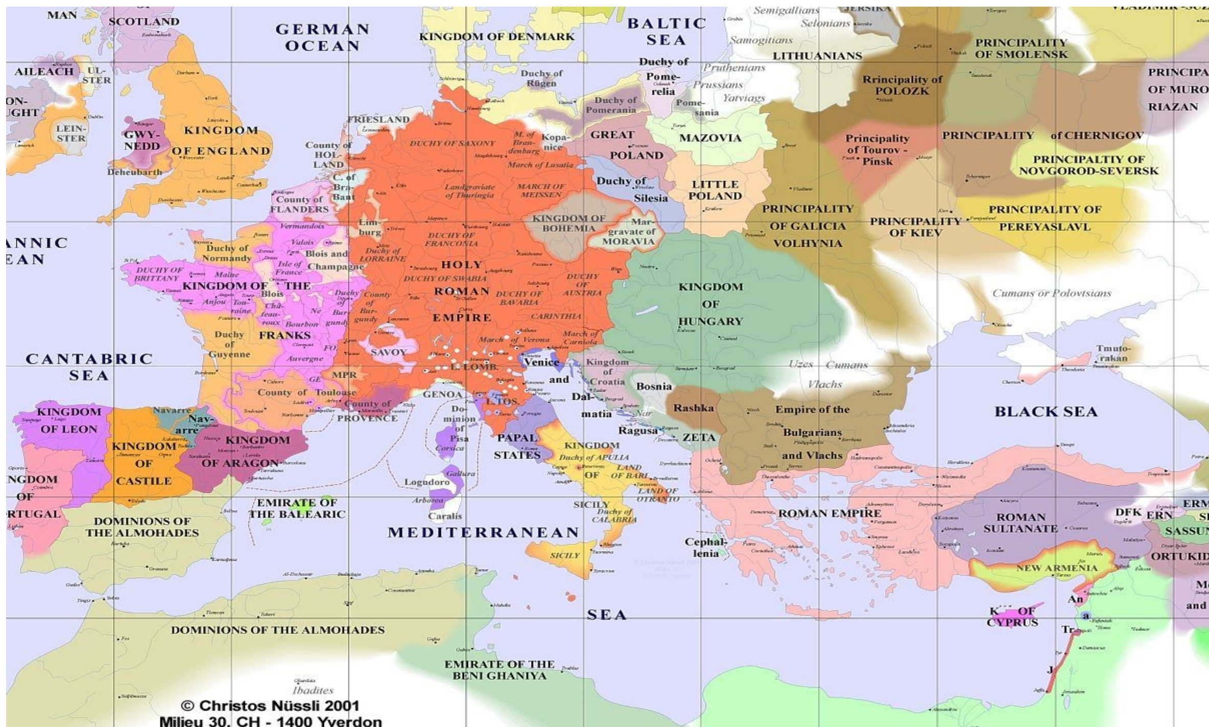
© Christos Nüssli 2001 Milieu 30, CH - 1400 Yverdon