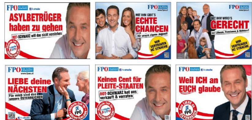
Figure 2. The six poster ads by the Austrian Freedom Party used as stimuli in the experimental design (from top to bottom, left to right: Posters 1–6). Copyright: Austrian Freedom Party.