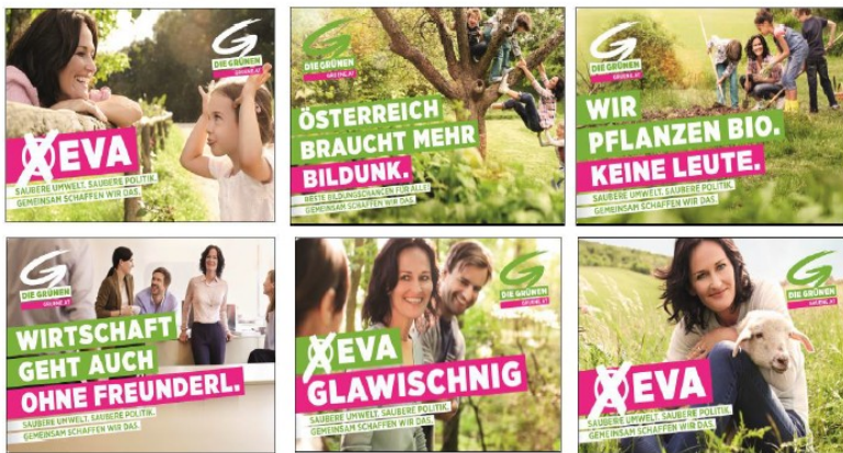
Figure 1. The six poster ads by the Austrian Green Party used as stimuli in the experimental design (from top to bottom, left to right: Posters 1–6).