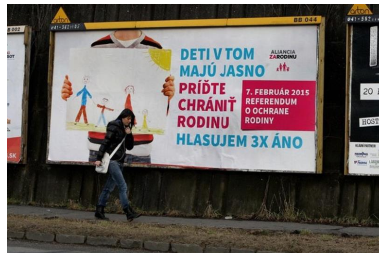
Slovensko, 2015, „Referendum za rodinu“