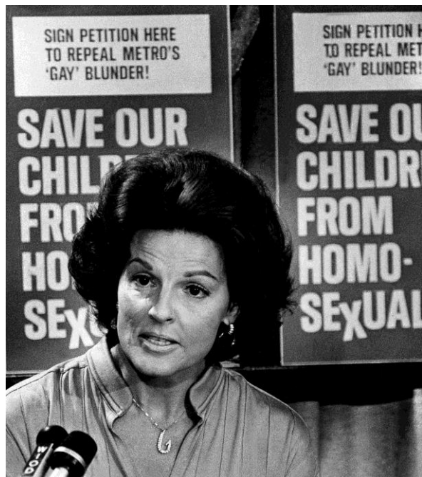
USA, 1970s, Anita Bryant