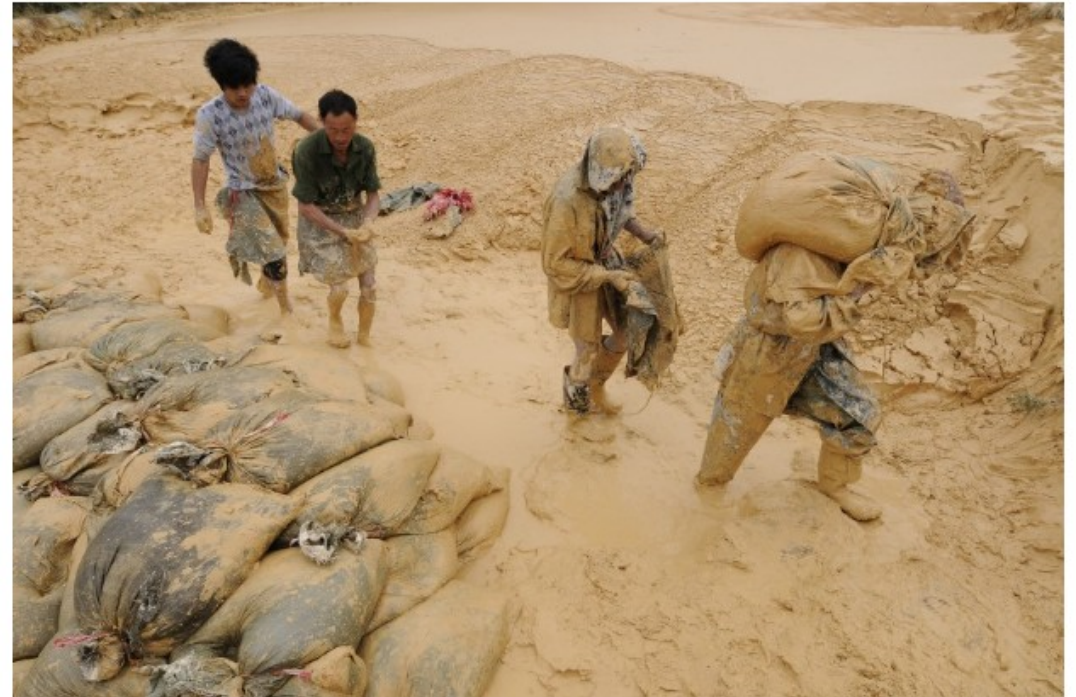
Laborers work at the site of a rare-earth mine in Jiangxi province, China, on Oct. 20, 2010. China has denied a report that the government plans to slash export quotas of rare earths next year, seeking to ease international jitters about China's stranglehold on supplies.

https://www.youtube.com/watch?v=NtNU261NVrg